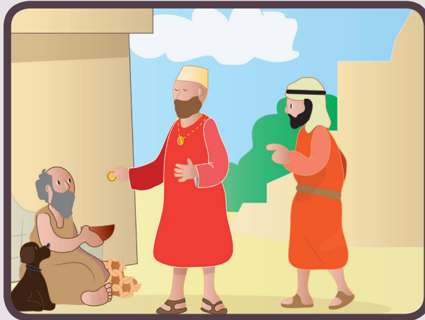
Ci sono persone che fanno il bene per essere ammirati dalla gente e si sentono importanti.