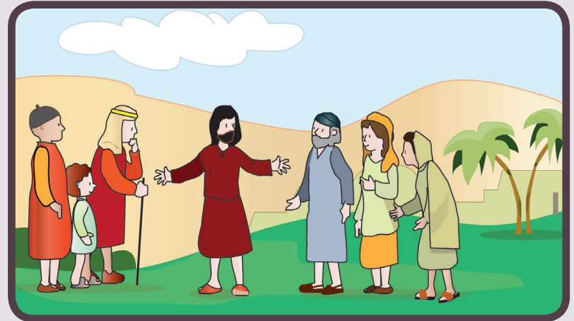
Gesù ci ricorda che Dio è Padre e noi siamo fratelli, aiutare gli altri quindi è normale per un cristiano e possiamo farlo sempre. (cf Mt 23,5-12)