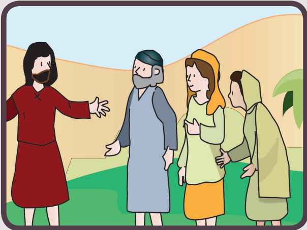
Gesù parla alla folla e ai suoi discepoli.

“Chi tra voi è più grande, sarà vostro servo” (Mt 23,11)